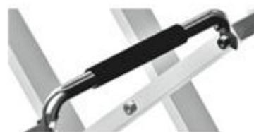
Ručke s mogućnošću izvlačenja