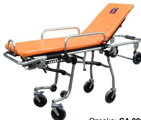
Oznaka: CA 00051 E

Samoutovariva nosila Carrera PRO S je koncipirana da služi prvenstveno transportu pacijenata.