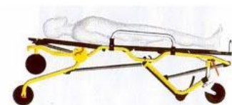
Slika 1 i 2: Podešavanje visine