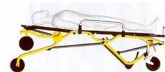
Slika 1 i 2: Podešavanje visine