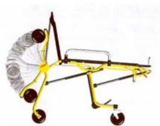
Slika 3: skraćivanje dužine nosila