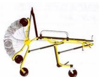
Slika 3: skraćivanje dužine nosila