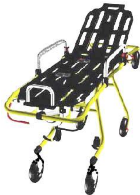
Oznaka: CR 00051

Nosila Cross su opremljena velikim gumenim kotačima promjera \varnothing 200 mm koji omogućuju olakšani prijevoz na neravnim površinama.